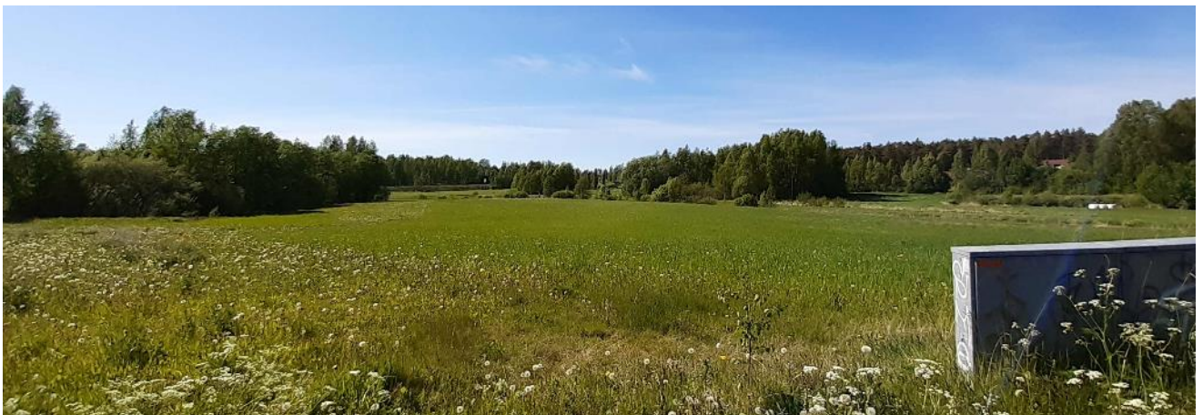
Bild 3. Vy från Läppåkersgatan mot kvarter 5207. Kuva 3. Näkymä Lepinpellon kadulta kortteliin 5207

Lepinpellonkatu on rakennettu noin kaavamutosalueen puoleen väliin asti. Lepinpellonkadun itäpäästä on rakennettu pyörätie kaavamutosalueen pohjoispuolella oleville asuntoalueille. Alueella on vesijohto- ja jätevesijohtoverkosto.