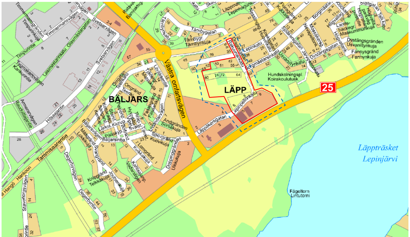
Bild 2. Planområdets läge och närinfluensområde

Suunnittelualue sijaitsee Karjaan taajaman länsiosassa Lepin alueella, valtatie 25 ja Längtisen ohikulkutien (seututie 111) risteysalueen itäpuolella ja on pinta-alaltaan noin 8,2 ha. Lepin liikealueelta matkaa Tammissaaren keskusta on noin 15 km ja Karjaan keskusta runsas 3 km. Helsingistä Lepin liikealueen kohdalle on matkaa noin 78 km. Kaava-alueen sijainti on esitetty kansilehdellä.