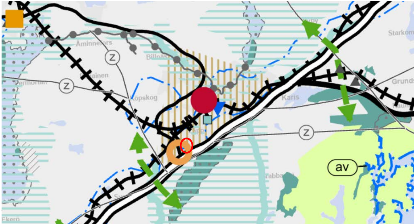
Bild 6. Utdrag ur Nylandsplanen 2050. Planeringsområdet är märkt med röd oval.

Lisäksi hallinto-oikeus kumosi Uudenmaan ELY-keskuksen valituksen perusteella kaavamääräyksestä osan, joka koski vähittäiskaupan suuryksiköiden koon alarajoja muualla kuin pääkaupunkiseudulla sijaitsevilla taajamatoimintojen kehittämissuunnitelmissa. Maakuntakaavalla oli määrätty, että näillä alueilla seudullisia vaikutuksia on vain vähintään 10 000 kerrosalaneliömetrin suuruisella vähittäiskaupan myymälällä.