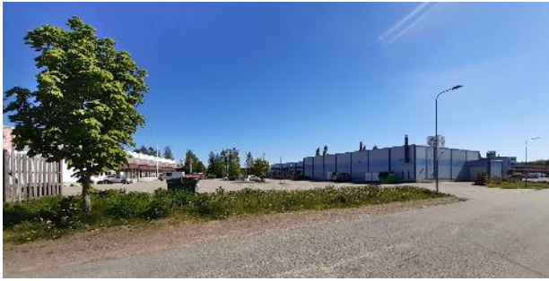
Bild 4. Mitt emot planeringsområde är kvarter 5202, där RTV och K-Järn är belägen. Kuva 4. Vastapäätä kaavamuutosaluetta on kortteli 5202, jossa sijaitsevat RTV ja K-rauta.