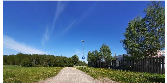
Bild 5. Från östra ändan av Läppåkersgatan går en cykelväg till bostadsområdena norr om planeringsområdet Kuva 5. Lepinpellonkadun itäpäästä on rakennettu pyörätie kaavamuutosalueen pohjoispuolella oleville asuntoalueille.

Förvaltningsdomstolen upphävde på basis av naturskyddsföreningars besvär de beslut i landskapsplanerna som skulle ha upphävt beteckningar för Natura 2000-områden och beteckningar för naturskyddsområden i tidigare landskapsplaner. Nämnade skydds-beteckningar, som finns i tidigare landskapsplaner, förblev med andra ord i kraft.