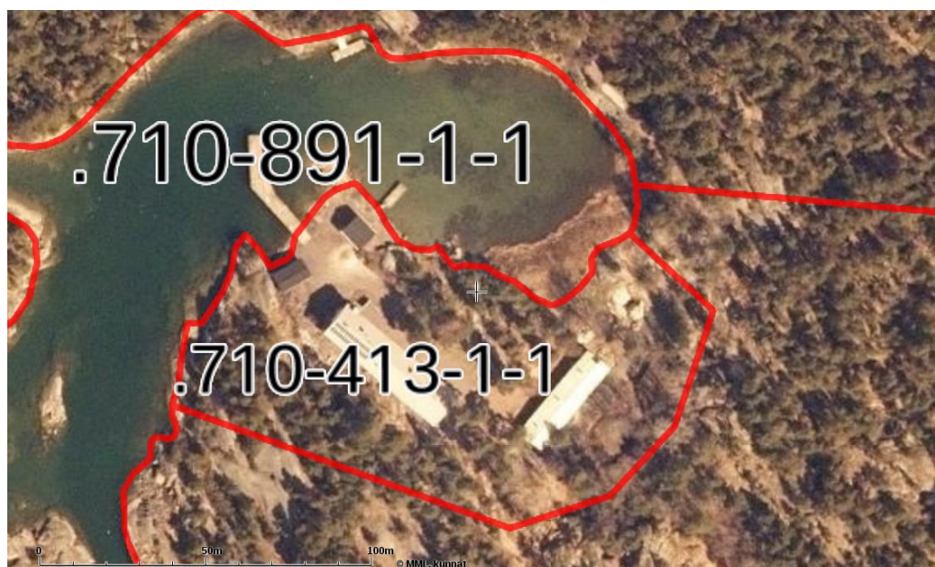
Kaava-alue käsittää kiinteistön 710-413-1-1. Ilmakuvauksen jälkeen kuvan keskellä oleva vanha merivartiorakennus ja sen rannanpuoleinen talousrakennus on purettu.