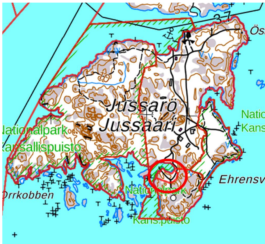
Kaava-alueen sijainti Jussarössä (rengastettu punavärillä).