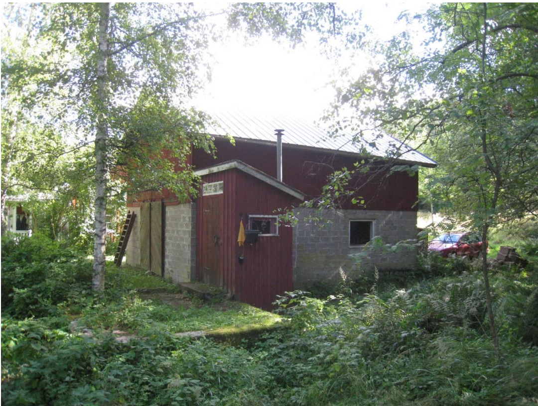
Bild 18: Gammal ekonomibygggnad på tomt 1. Foto taget från väster.