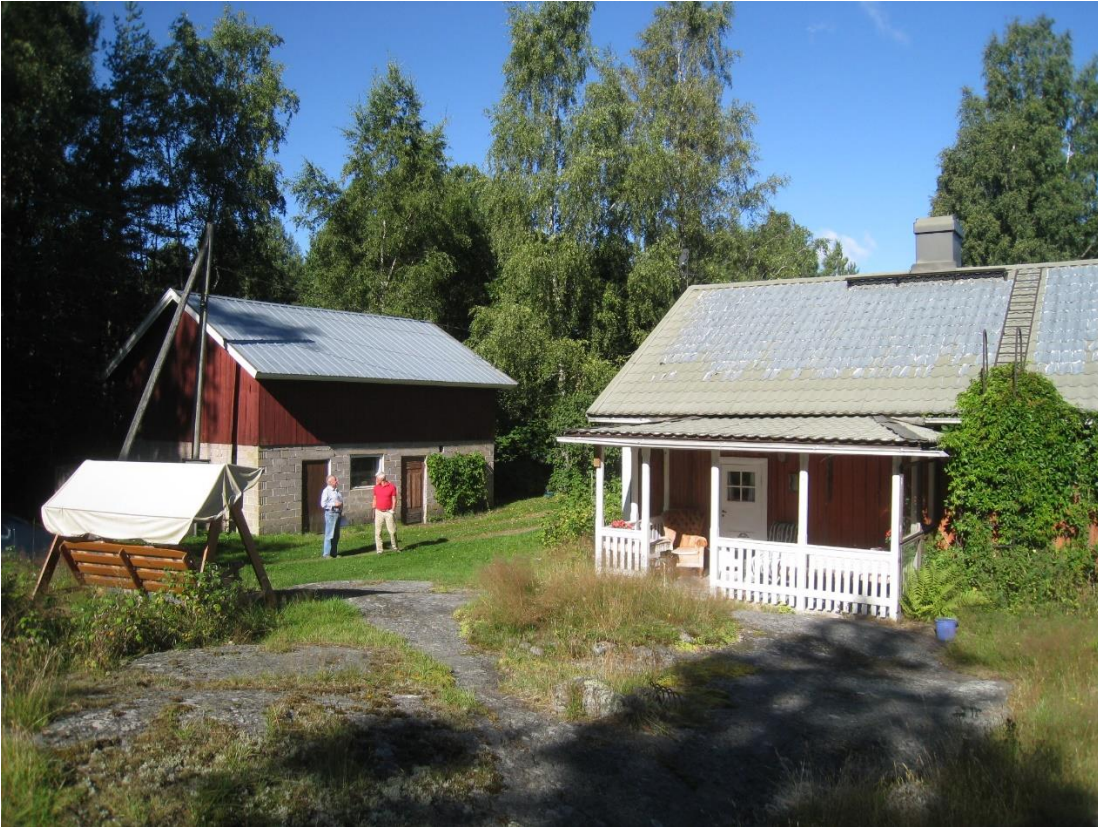
Bild 1: Gammal röd stuga och gammal del av ekonomibyggnad. Foto taget från ost/sydost.