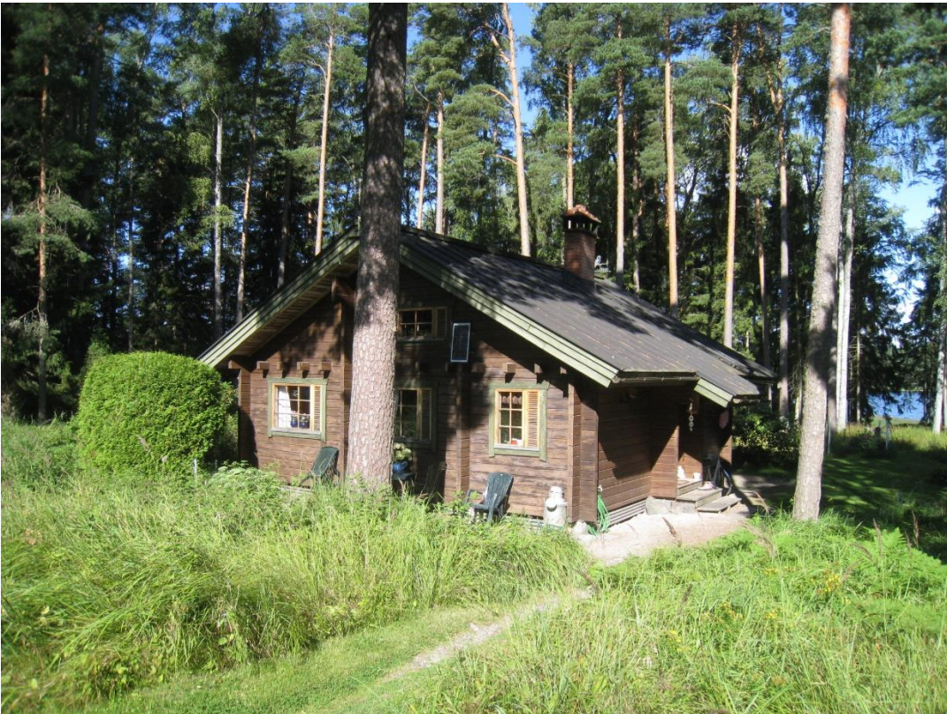
Kuva 10: Loma-asunto tontilla 2.