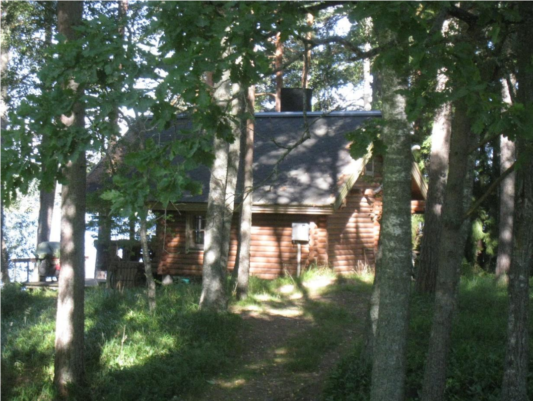
Kuva 15: Sauna tontilla 1.