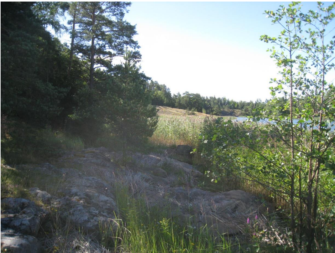
Kuva 22: Kaavan keskiosan länsirantaa.