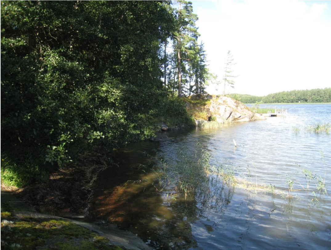
Kuva 21: Niemen pohjoisrantaa.