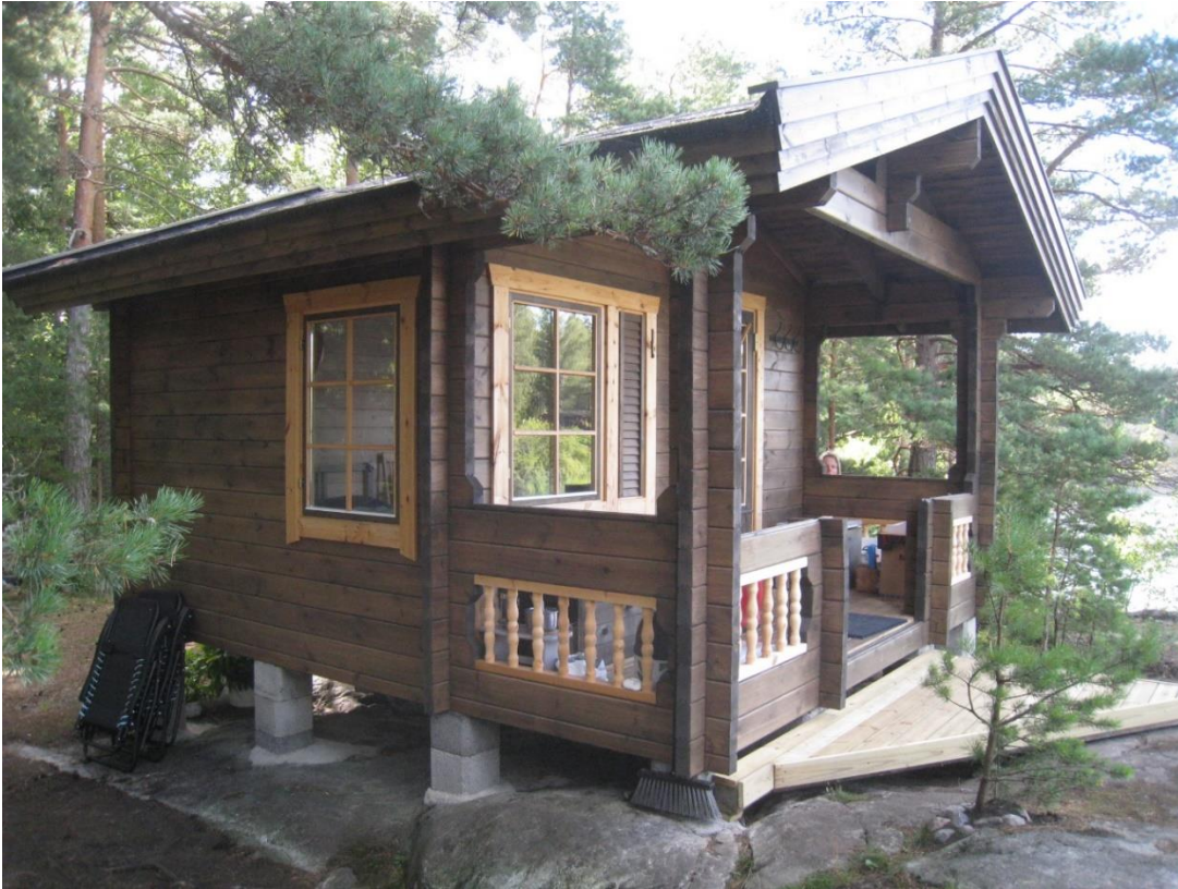
Kuva 19: Nykyisin tontilla 1 sijaitseva huvimaja-/mökki.