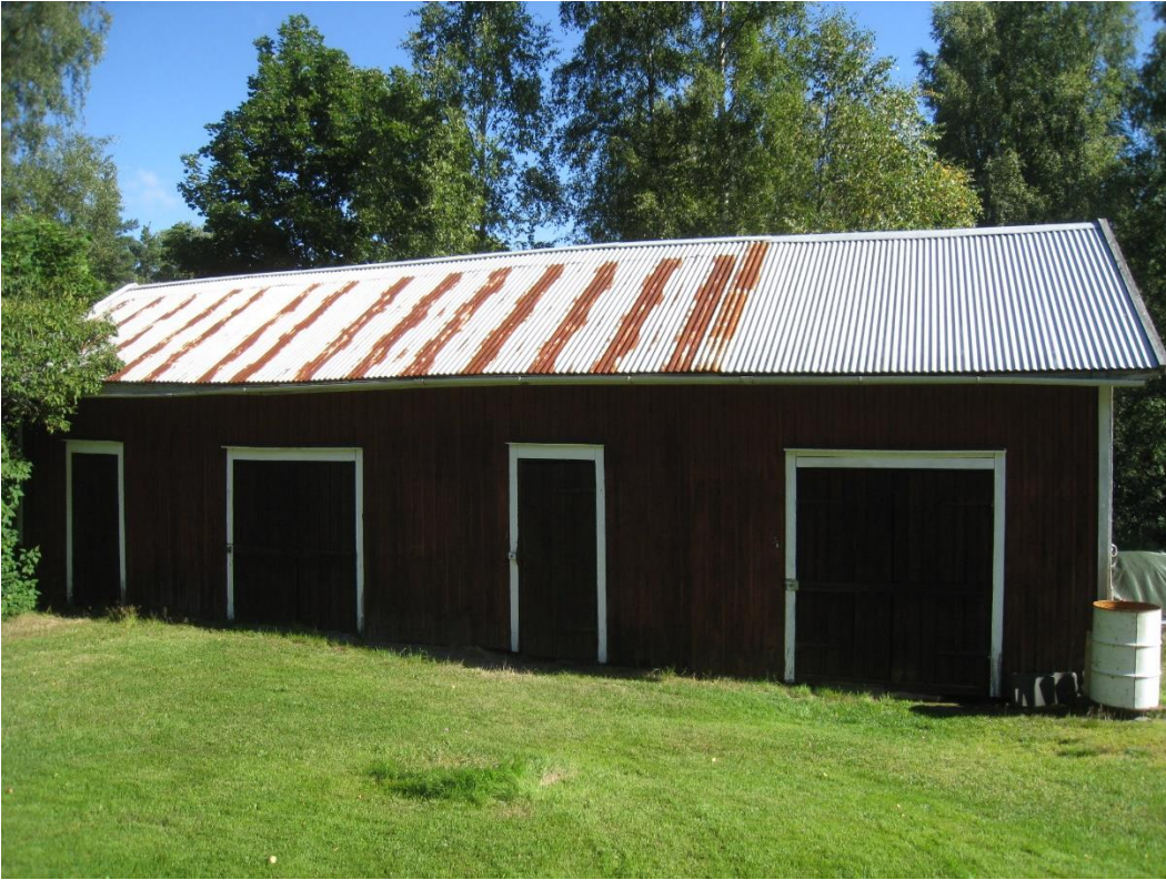
Kuva 5: Vanha piharakennus. Näkyy kuvassa 2.