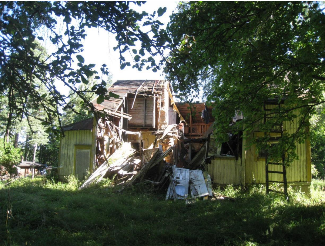
Kuva 8: Kuvassa 7 näkyvän rakennuksen sortunut osuus.