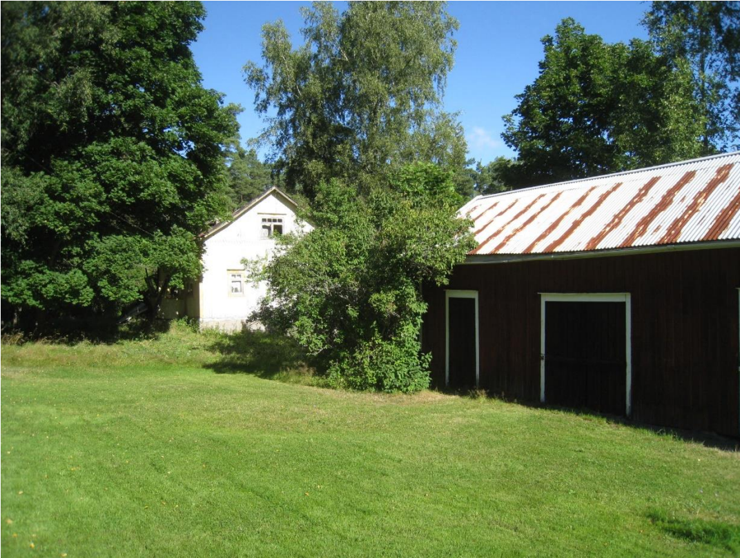
Kuva 7: Kuvien 5 ja 6 vanha piharakennus oikealla. Taustalla vanha, puoliksi sortunut rakennus.