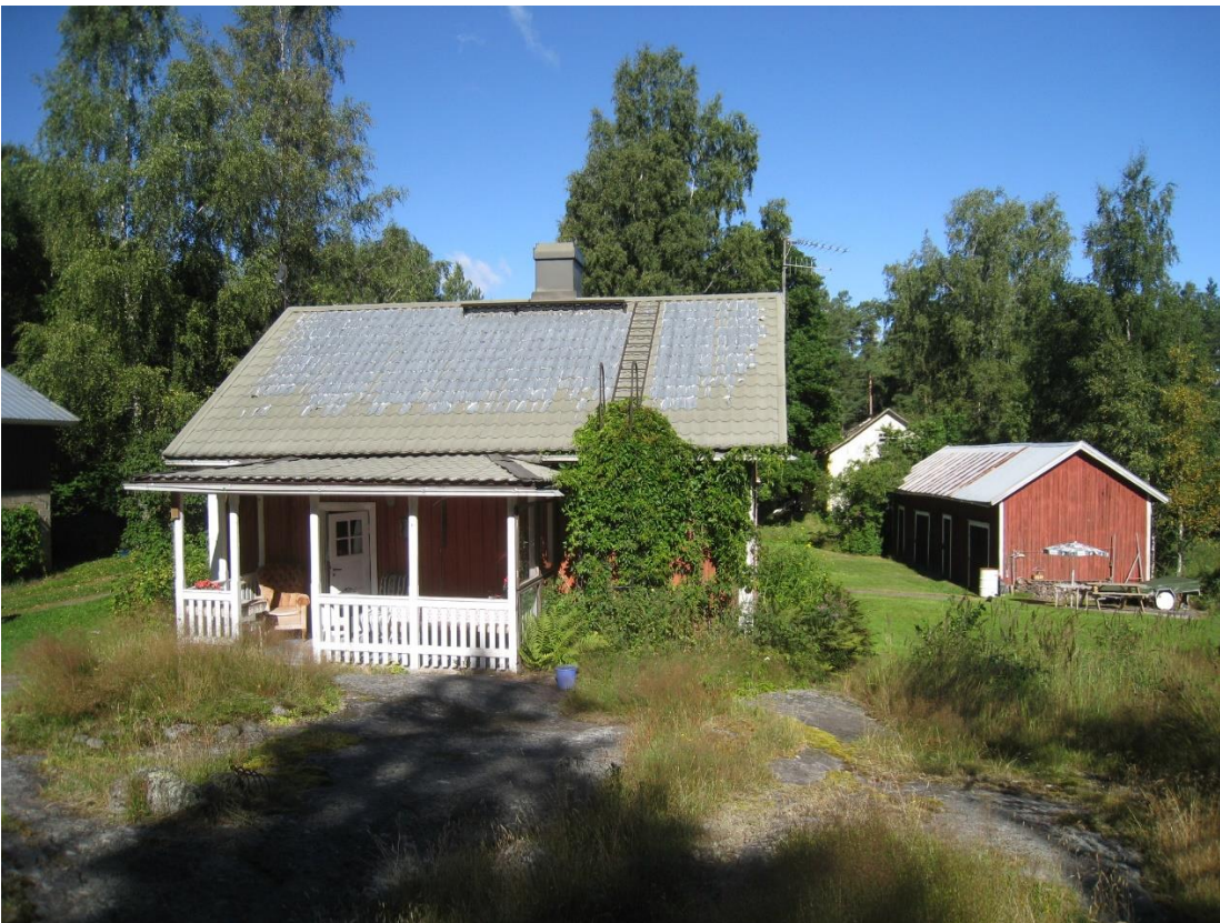
Kuva 2: Vanha punainen mökki ja vanha talousrakennus. Kuva itä-kaakkoissuunnasta.