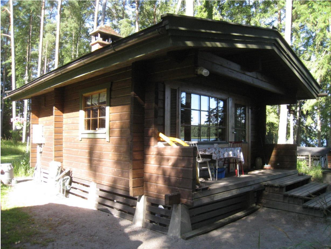
Kuva 13: Sauna tontilla 2.