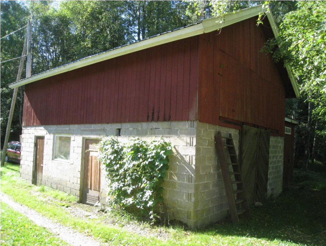
Kuva 17: Vanha talousrakennus tontilla 1. Kuva pohjoissuunnasta.