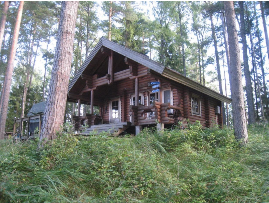
Kuva 16: Sauna tontilla 1.