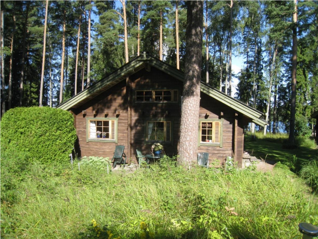
Kuva 9: Loma-asunto tontilla 2.