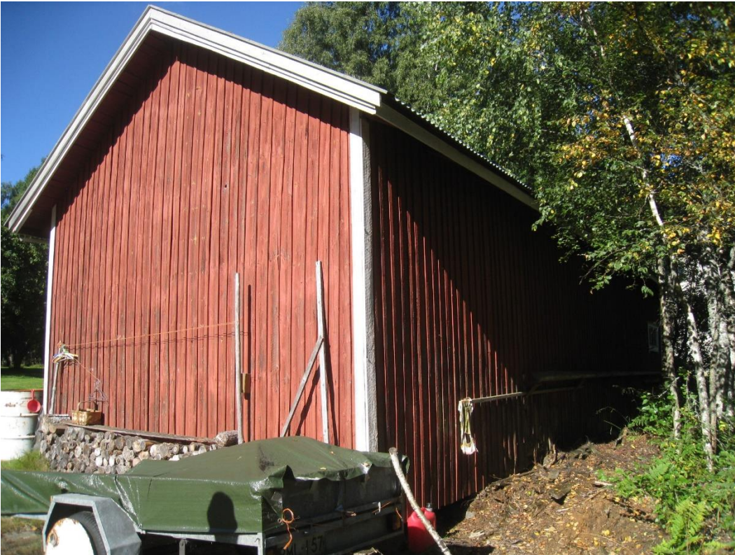
Kuva 6: Vanha piharakennus. Kuva kaakosta.