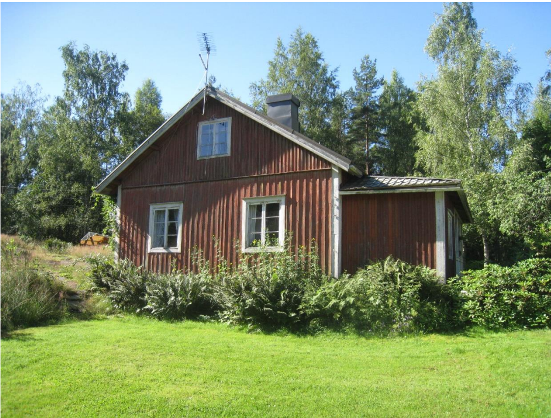
Kuva 4: Vanha punainen mökki. Kuva koillissuunnasta.