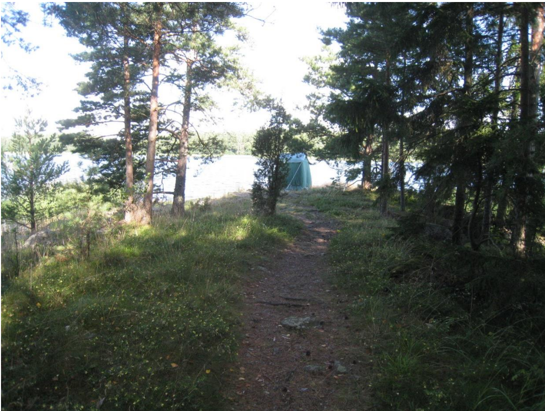
Kuva 14: Tontin 1 ja 2 välissä niemen kärkeen kulkeva polku.