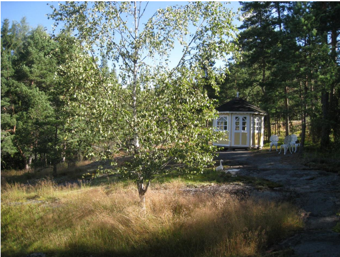
Kuva 20: Huvimaja kalliolla punaisen mökin itäpuolella.