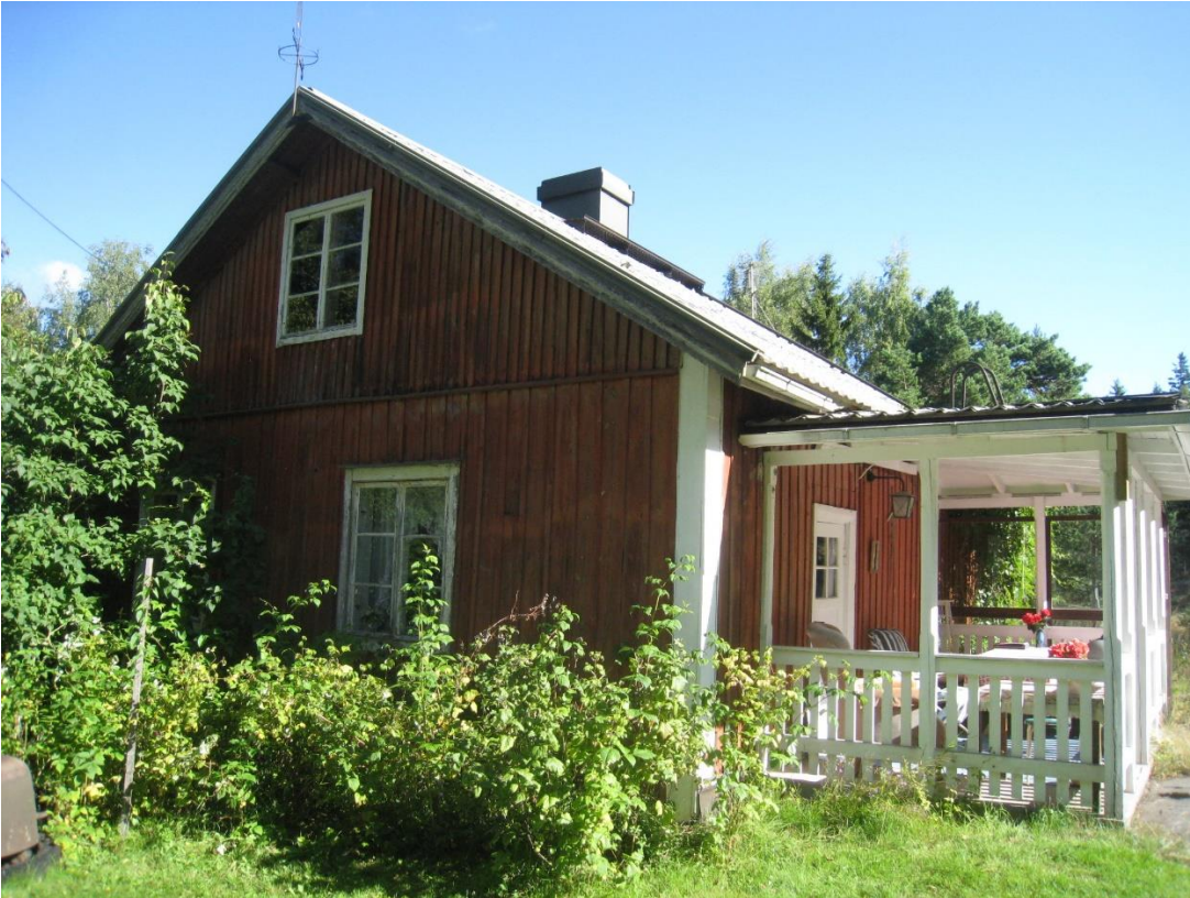
Kuva 3: Vanha punainen mökki. Kuva länsi-lounaissuunnasta.