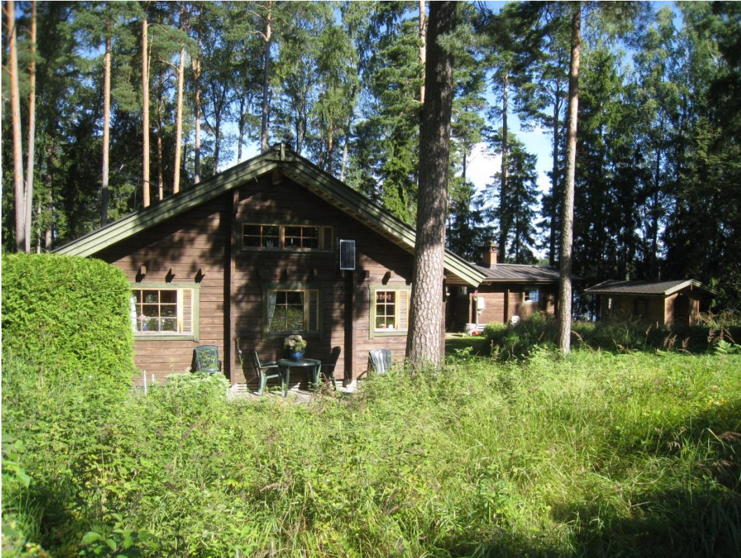
Kuva 11: Loma-asunto, sauna ja pihamaja tontilla 2.