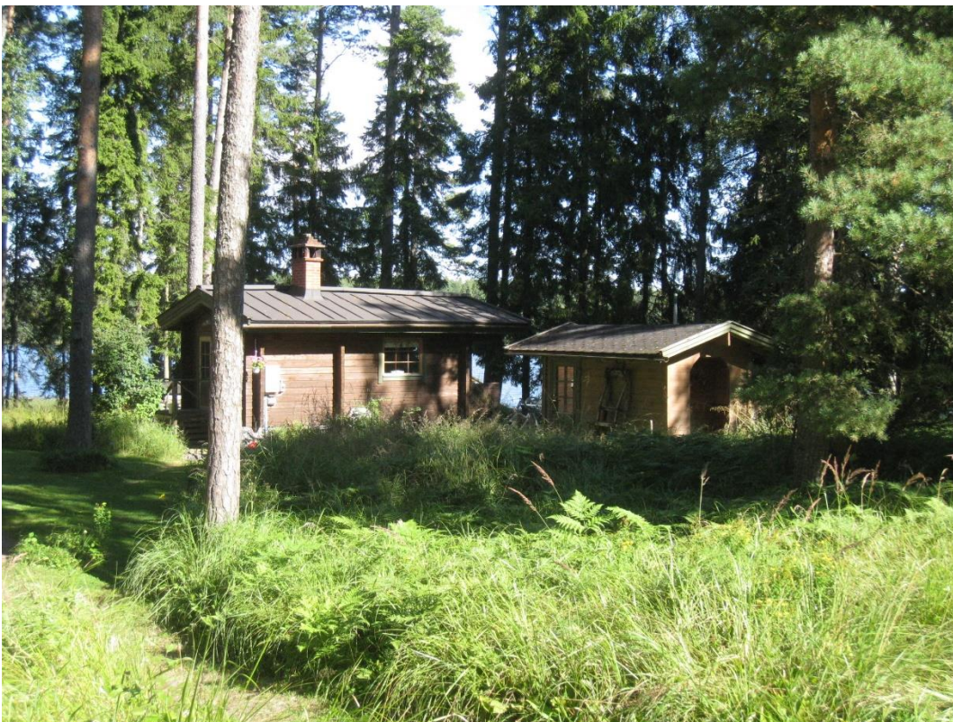
Kuva 12: Sauna ja pihamaja tontilla 2.