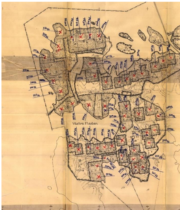
Bild 4. Parcelleringsplanen från 1960-talet.

Över området har på 1960-talet uppgjorts en sk. parcelleringsplan. Planen har i tiden utgjort grund för beviljande av bygglov, men den saknar numera någon som helst juridisk betydelse och styr inte uppgörandet av stranddetaljplan.