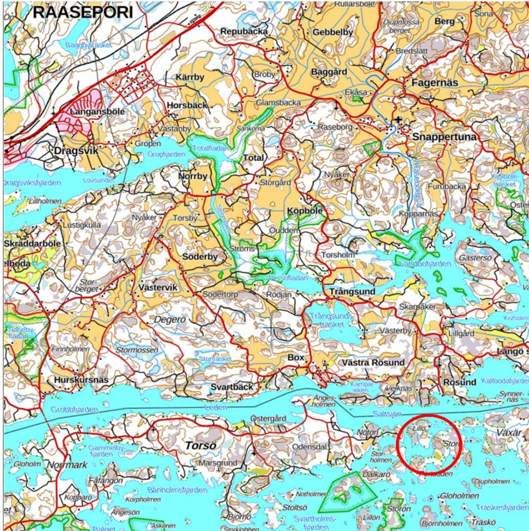
Bild 1. Planområdet ligger väster om Torsö i Snappertuna.