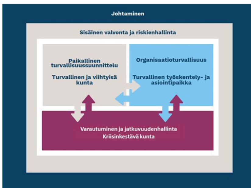
Figur 1. Säkerhetsledarskapet som helhet

Ledarskapet i staden samt den interna kontrollen och riskhanteringen utgör ramen för säkerhetsledarskapet och fastställer principerna för ordnandet och genomförandet av säkerhetsledarskapet. (Figur 1, säkerhetsledarskapet som helhet).