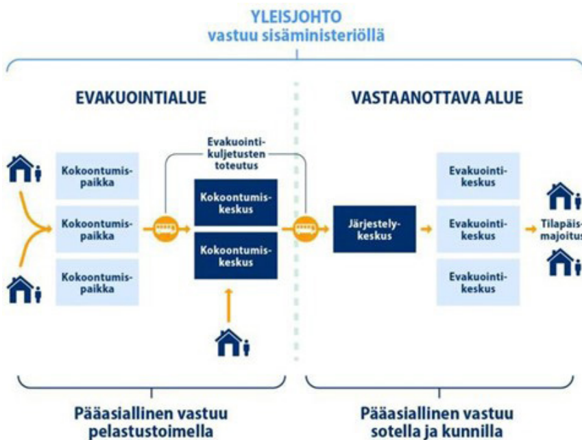
Kuvio 5. Väestön siirtämisen ja vastaanottamisen vastuut Evakuointeihin ja väestönsiirtoihin liittyvät valmiussuunnitelmat eivät ole julkisia.