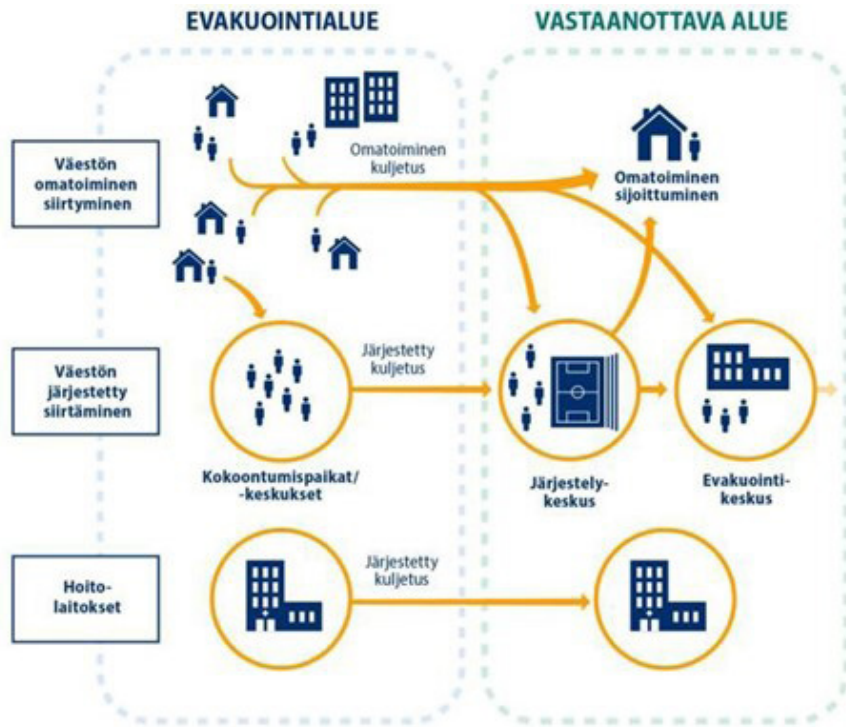
Kuvio 4. Väestön siirtyminen, siirtäminen ja hoitolaitosten siirrot