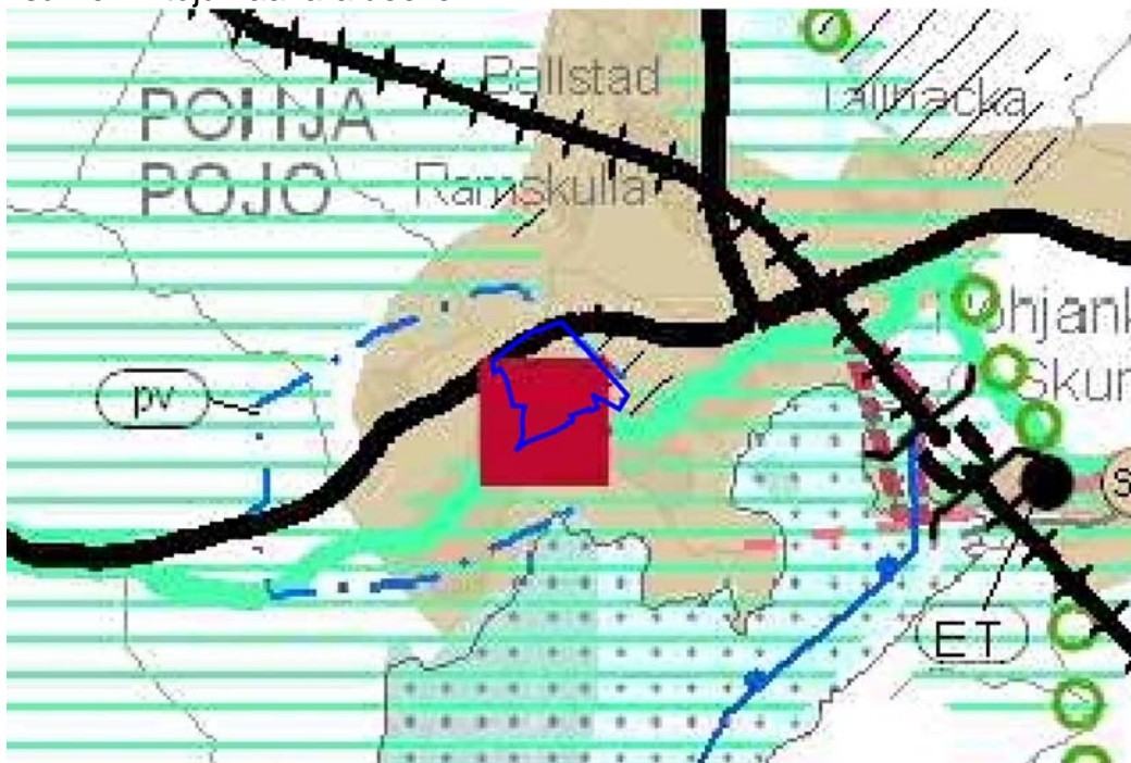
Kuva 1. Ote Uudenmaan maakuntakaavasta. Kaava-alueen rajausta sinisellä viivalla.

Toisessa vaihemaakuntakaavassa, joka on hyväksytty maakuntavaltuustossa maaliskuussa 2013 ja odottelee ympäristöministeriön vahvistamista, ei ole määritelty lisämerkintöjä kaava-alueelle.