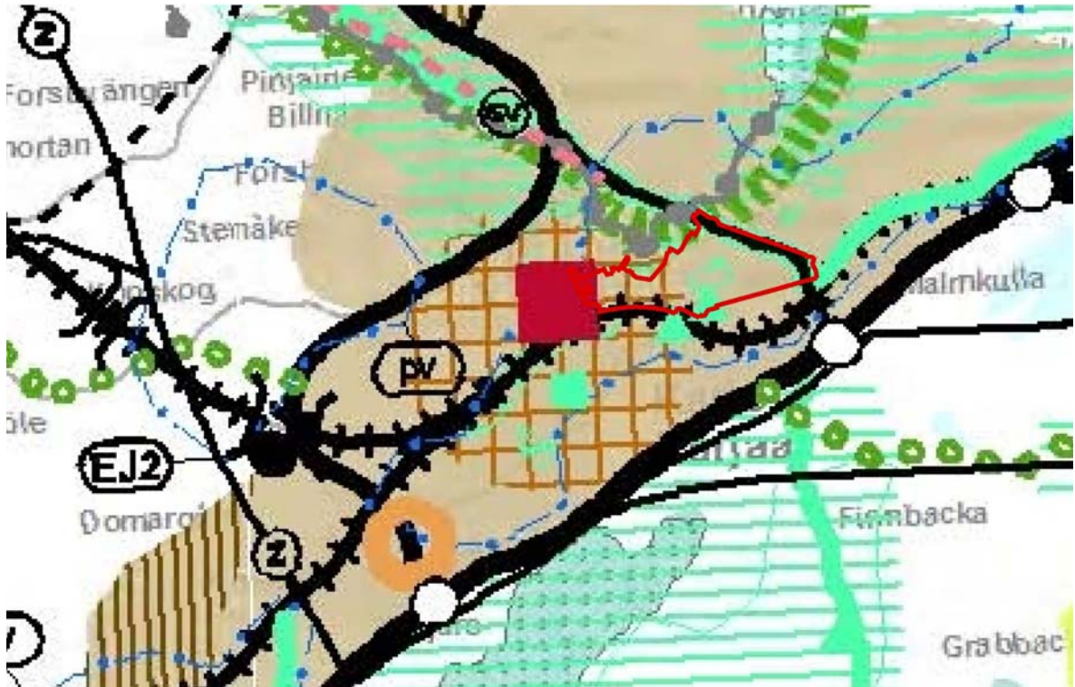
Kuva 2. Ote Uudenmaan maakuntakaavan ja 2. vaihemaakuntakaavan yhdistelmäkartasta. Kaava-alueen raja- us punaisella viivalla.