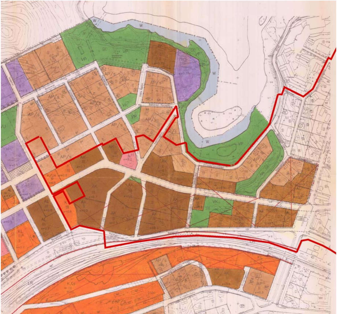
Kuva 4. Ote Karjaan keskustan osayleiskaavasta. Kaava-alueen rajausta punaisella viivalla.