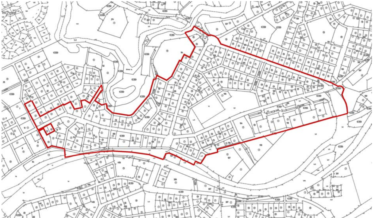
Kuva 1. Alueen kiinteistöjaotus. Kaava-alueen rajausta punaisella viivalla.